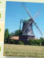
Südlohn, Mühle Menke