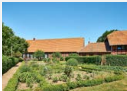
DIE GARTENANLAGE VOM HOF HÖWISCHE

Strukturwandel veranlasste die jetzigen Inhaber, wie so viele, zu einem Berufswechsel und zur Einschränkung der Landwirtschaft. Neue Nutzungen der Gebäude mussten gefunden werden. Die Kinder und Enkel der Familien wollen den Hof erhalten. Dazu muss die Hofanlage und ihre Gebäude wieder mit dem umliegenden Land zusammengebracht werden. Die Zukunft ist also nicht weniger herausfordernd, als es die Vergangenheit war.