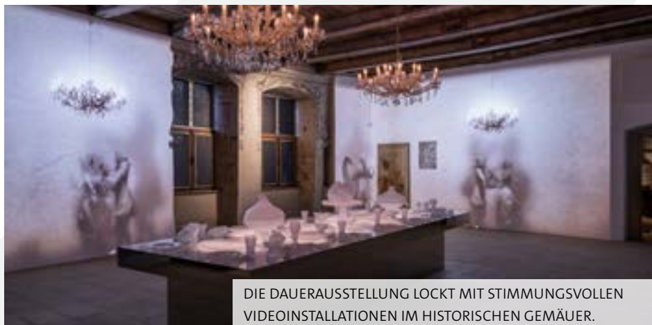
DIE DAUER AUSSTELLUNG LOCKT MIT STIMMUNGSVOLLEN VIDEOINSTALLATIONEN IM HISTORISCHEN GEMÄUER.