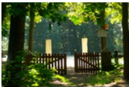
ZUGANG ZUM HEIDEFRIEDHOF LETTE

Der Heidefriedhof wurde 1950 auf Initiative der Altenpflegeheimbewohner des benachbarten Barackenlagers „Heidehof“ angelegt, welches jedoch derzeit nicht zugänglich ist. Die Verstorbenen konnten nun in unmittelbarer Nähe des Lagers bestattet werden. Das Pflegeheim sorgte für die Anlage und Gestaltung. Heute wird der Heidefriedhof durch eine Arbeitsgruppe des Heimat- und Verkehrsvereins Lette gepflegt. Jährlich an Allerheiligen findet ein Gedenken an die hier Beerdigten statt.