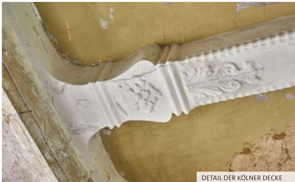
DETAIL DER KÖLNER DECKE

Altenwohnort über Schule mit Internat bis hin zu Hotel und Restaurant. Nach längerem Leerstand übernahm im Jahr 2015 der gemeinnützige Verein Schloss Senden e.V. die denkmalgeschützte Anlage. Seitdem herrscht wieder Aufbruchstimmung. Mit öffentlicher Unterstützung, durch zahlreiche Spenden und mit ehrenamtlicher Hilfe wird das Baudenkmal restauriert. Gäste können den Sanierungsprozess hautnah begleiten – was das Schloss zur wohl schönsten Baustelle des Münsterlandes macht.