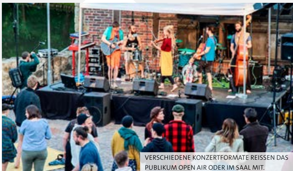
VERSCHIEDENE KONZERTFORMATE REISSEN DAS PUBLIKUM OPEN AIR ODER IM SAAL MIT.

Sonderausstellungen mit renommierten Kunstschaaffenden oder kulturhistorischen Sonderschauen. Auch die etablierte Burg-Jazz-Reihe und weitere Konzertformate sowie ein breites kulturelles Bildungsangebot aus Workshops, Führungen, Lesungen und vielem mehr lockt jährlich rund 40.000 Besuchende zum altherwürdigen Adelsitz.