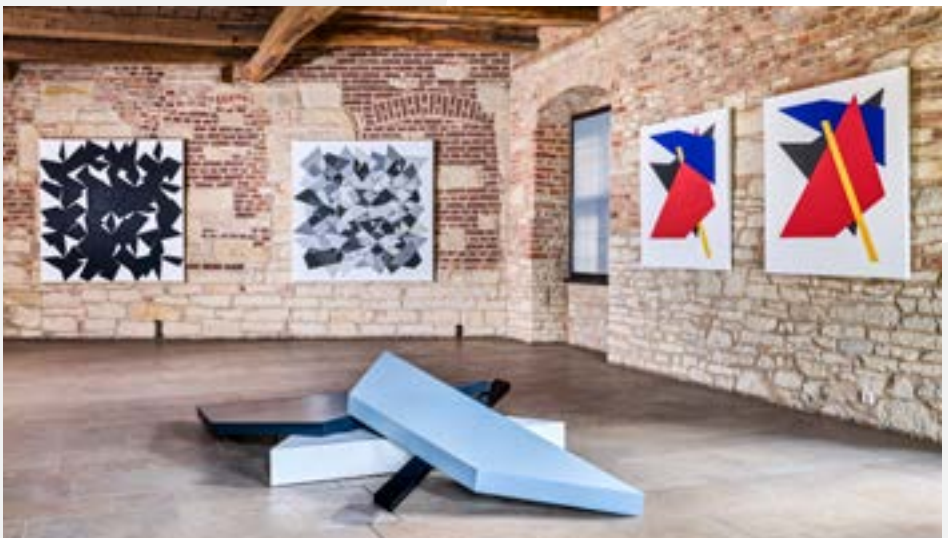
DIE AUSSTELLUNGEN IN DER KOLVENBURG STELLEN ZEITGENÖSSISCHE KUNST UND HISTORISCHE ARCHITEKTUR IN EIN BESONDERES WECHSELSPIEL.

gen Geschichte der Kolvenburg zeugt. Aber auch ein vielseitiges Kulturprogramm mit hochkarätigen Konzerten, Ausstellungen zeitgenössischer Kunst bis hin zu den seit Jahrzehnten beliebten Advent- und Frühlingsmärkten lockt in historischem Ambiente Besuchende in die Kolvenburg.